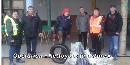
Opération « Nettoyons la nature »