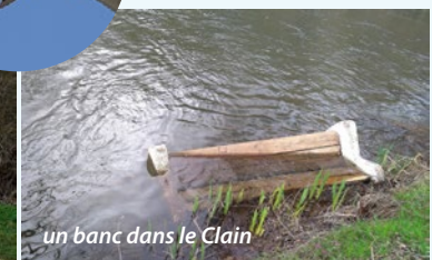
un banc dans le Clain