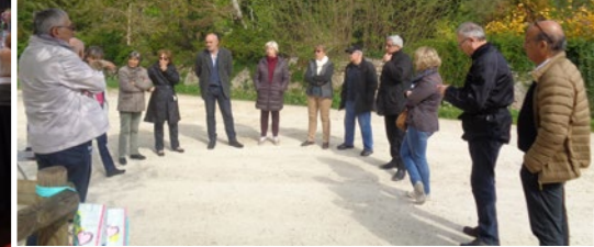
Une visite de quartier à Moulin