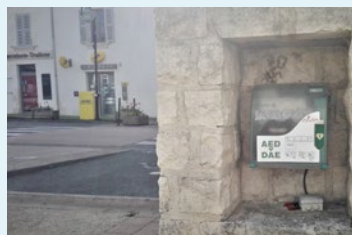
Défibrillateur place de la Mairie

IMPORTANT : Toute personne, même non médecin, est habilitée à utiliser un Défibrillateur Automatisé Externe. Il suffit de suivre les instructions données par l'appareil.