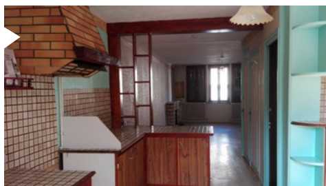
Maison 6 impasse de la Cadoue