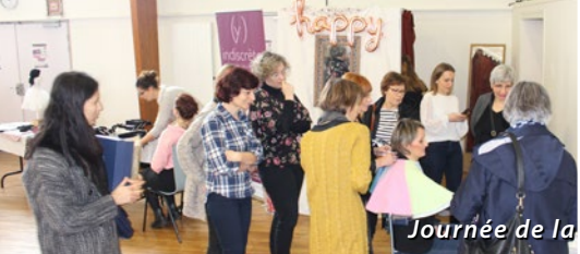
Journée de la Femme Smarvoise